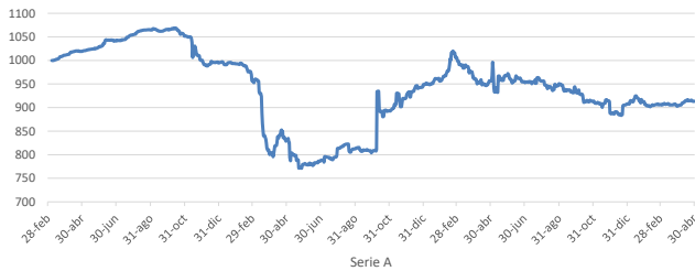
AMERIS DEUDA CHILE FONDO DE INVERSIÓN