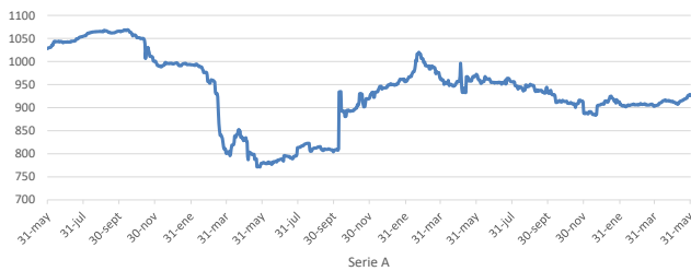
AMERIS DEUDA CHILE FONDO DE INVERSIÓN