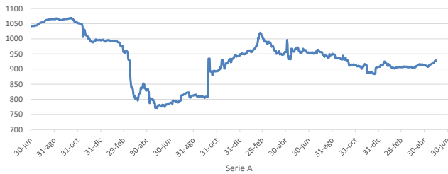
AMERIS DEUDA CHILE FONDO DE INVERSIÓN